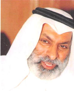
د. عبد الله النفيسي

ألا تلاحظ أيها القارئ أن التيار الإسلامي (الجماعة والأحزاب والتنظيمات والمؤسسات) ينمو بشكل متسارع ولا نبالغ إذا قلنا بشكل (ورمي). يلاحظ كذلك أن هذا التيار يعيش مشكلة كبيرة على صعيد المفاهيم، والتنظيم، والاتصال، والتعاون البيئي، والمعرفة، والجمهور المخاطب، والموارد البشرية، والمنافسة.